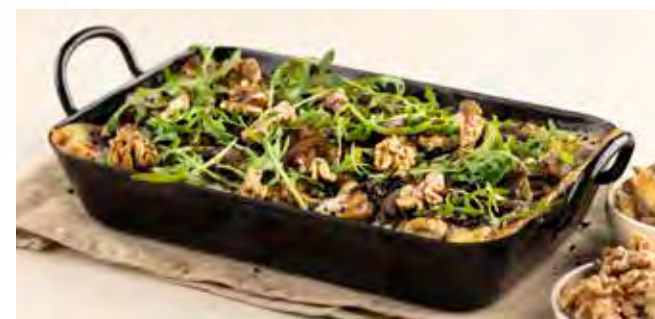
Millefoglio alla Tartufata (4/6 PERS.)

Huisbereide verse pasta, ragout van oesterzwammen, ricotta met truffel, lente-uitjes, truffelcrème, walnoten, fijn gesneden halfgedroogde olijven en Grana Padano DOP.