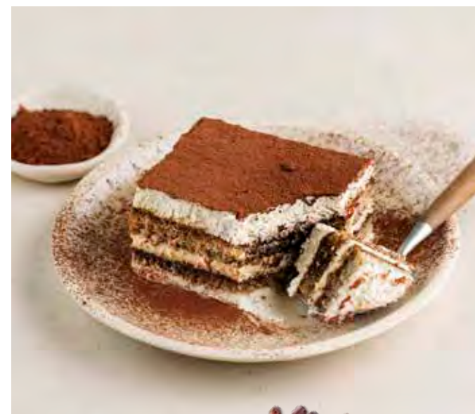
Tiramisù Classico € 3,95/portie Traditionele tiramisù mascarpone en koffie