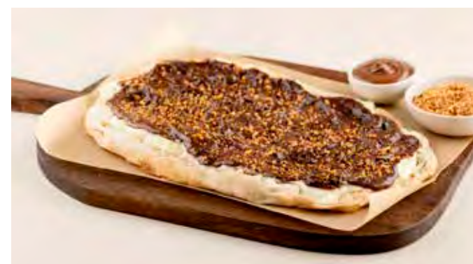
Pinsa NUTELLA® e Mascarpone € 7,95 Pinsa met zuurdesem, mascarpone, NUTELLA, praline