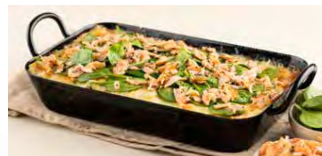
Lasagne Salmone bassa temperatura (4/6 PERS.)

Huisbereide verse pasta, op lage temperatuur gegaarde zalm, witte wijn, dille, Siciliaanse ricotta, spinazie, provolone DOP, Grana padano DOP en mozzarella di bufala.