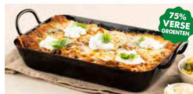
Lasagne di Verdura (4/6 PERS.)

Huisbereide verse pasta, groentesaus met 75% verse groenten, huisbereide pesto van verse courgette, burrata DOP, provolone DOP en mozzarella di bufala.