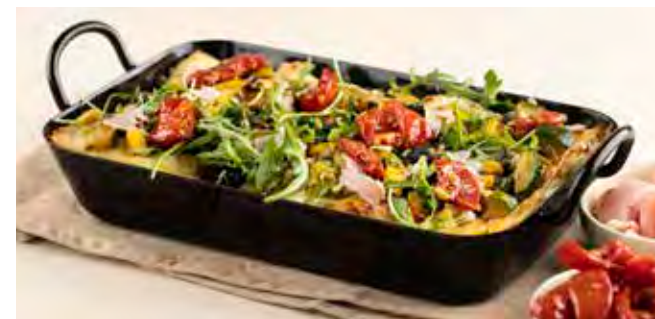
Millefoglio di Zucchine (4/6 PERS.)

Huisbereide verse pasta, duo van courgettes, zachte ricotta van geitenmelk, huisbereide pesto genovese, halfgedroogde tomaten, oregano, ham met kruiden, parmezaansaus en gojibessen.