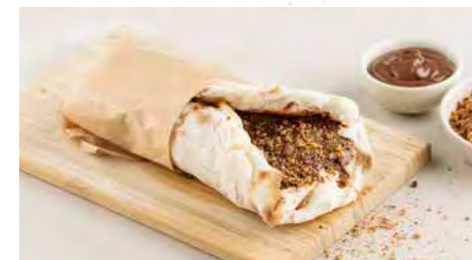
Mezza Pinsa NUTELLA® e Mascarpone € 4,95 Pinsa met zuurdesem, mascarpone, NUTELLA, praline