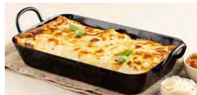
Lasagne alla Bolognese della Nonna (4/6 PERS.)

Huisbereide verse pasta, saus al ragù, bechamelsaus met rozemarijn, Grana Padano DOP, provolone DOP en mozzarella di bufala.