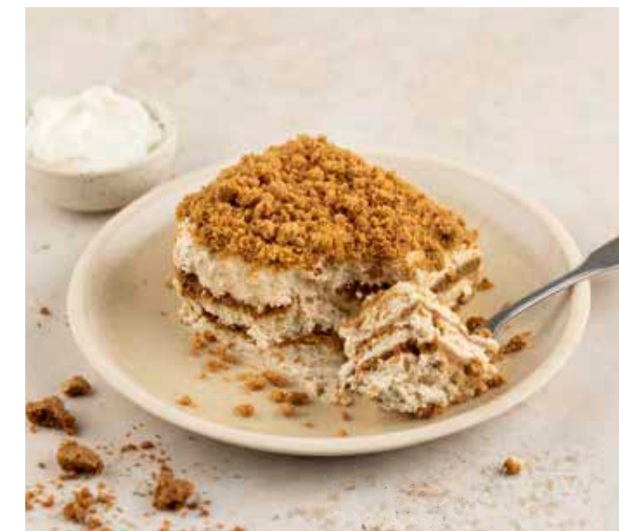
Tiramisù Belga € 3,95/portie Tiramisù mascarpone en speculaas