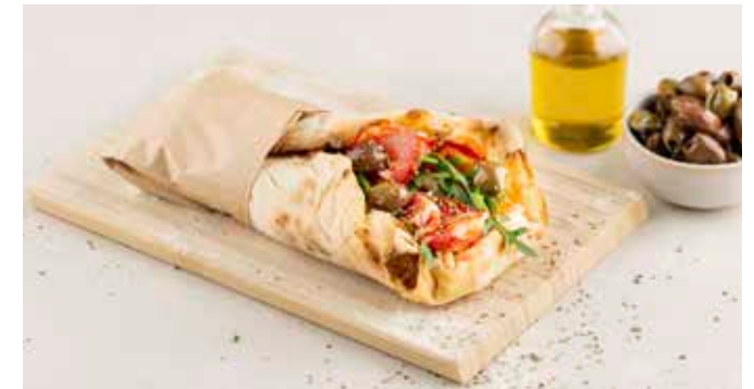
Mezza Pinsa Diavola € 5,95 Pinsa met zuurdesem, tomatensaus, mozzarella en geraspte provolone DOP, spianata piccante, Taggiasche olijven, rucola, olijfolie, oregano.