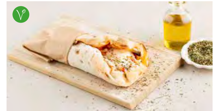
Mezza Pinsa Pomodoro € 5,50 Pinsa met zuurdesem, tomatensaus, mozzarella en geraspte provolone DOP, oregano.