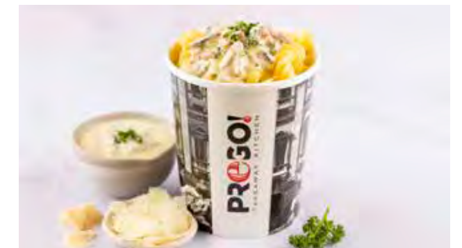
Fusilli Carboneta € 5,95 Huisbereide verse fusilli, spekjes, guanciale, room, pecorino romano, Grana Padano DOP en een snuffje nootmuskaat.