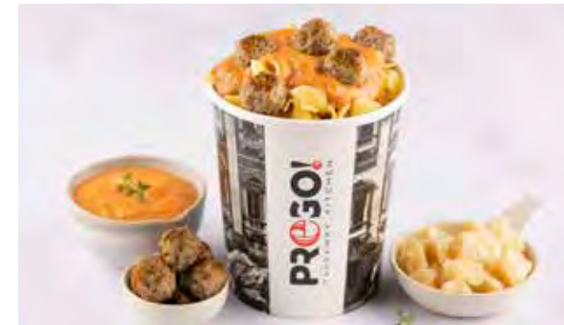
Fusilli alle Polpette € 6,95 Huisbereide fusilli, mini-polpette van Belgisch varkensvlees, tomatenroomsaus met paprikapoeder, kruidentuiltje.