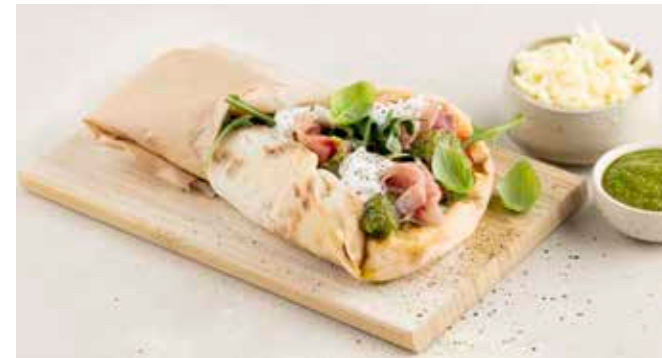
Mezza Pinsa di Parma € 7,45 Pinsa met zuurdesem, tomatensaus, mozzarella en geraspte provolone DOP, Parmaham, huisbereide pesto van rucola, burrata di bufala, rucola, olijfolie, oregano.