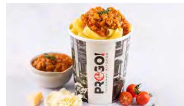
Rigatoni al Ragù Bolognese € 4,95 Huisbereide verse rigatoni, drie uren traag gegaard Belgisch rundvlees en varkensvlees, soffrito, gepelde tomaten uit Zuid-Italië en een kruidentuiltje.