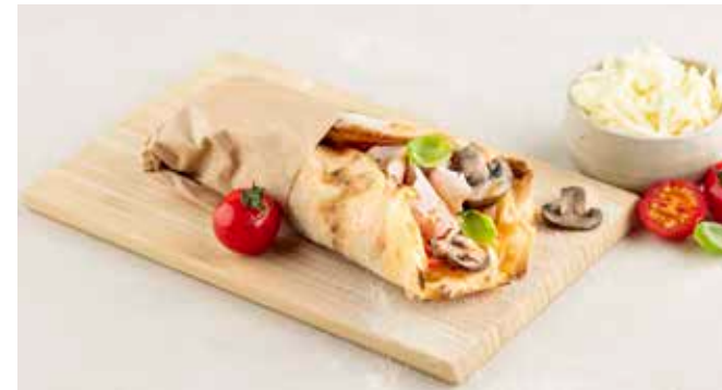
Mezza Pinsa Primavera € 6,95 Pinsa met zuurdesem, tomatensaus, mozzarella en geraspte provolone DOP, gekookte ham met kruiden, champignons, oregano, olijfolie, vers basilicum.