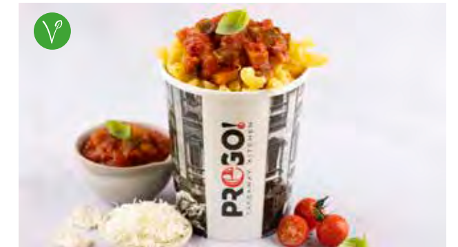
Trecce alla Norma € 5,95 Huisbereide verse trecce, soffrito, gebakken aubergines, gepelde tomaten uit Zuid-Italië en basilicum.