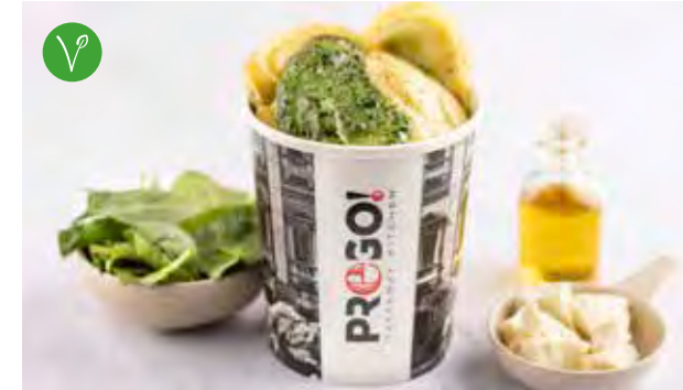
Anolini Spinaci e Ricotta € 7,95 Huisbereide verse ravioli. Vulling: Siciliaanse ricotta, Grana Padano DOP, verse spinazie en basilicum. Saus: romige spinazie.