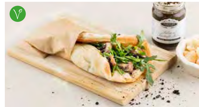
Mezza Pinsa bianca al Tartufo € 7,45 Pinsa met zuurdesem, witte basis van mascarpone, mozzarella en geraspte provolone DOP, crema di tartufo, champignons, rucola, geschaafde Grana Padano DOP, fijn gesneden halfgedroogde olijven.