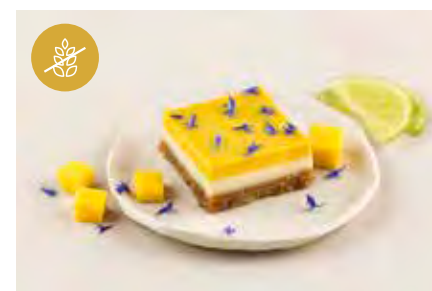
Mini Mango - Limone verde € 2,50 Vegan, glutenvrij en lactosevrij dessert Limoen- en mangosmaak