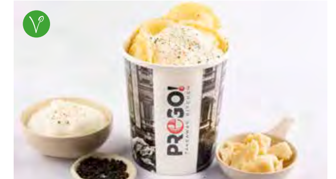
Anolini Cacio e Pepe € 7,95 Huisbereide verse ravioli. Vulling: Siciliaanse ricotta, pecorino, mascarpone en zwarte peper. Saus: crema di Pecorino.