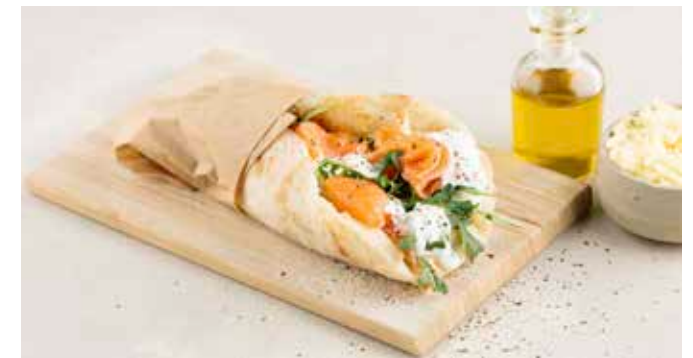
Mezza Pinsa bianca di Salmone € 7,45 Pinsa met zuurdesem, witte basis van mascarpone, mozzarella en geraspte provolone DOP, gerookte zalm, stracciatella di bufala, rucola, olijfolie.